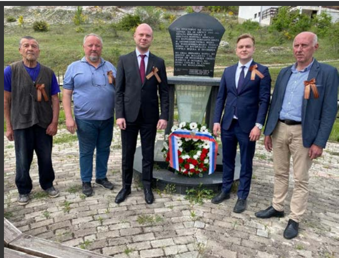
С. Здуње (Порече), 8 мај 2022.

Како што може да се види од објавените фотографии, на настанот присуствувале помалку лица отколку претходните години.