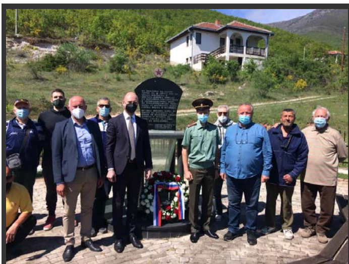
Село Здуње, Оддавање почит на паднатите борци, полагање цвеќе, 8 мај 2021.

Во 2021 година беа организирани мноштво настани. Маршот на Бесмртниот полк беше онлајн активност која беше најавена на фејсбук-страницата на Руската амбасада 32 дека ќе се одржи на 10 мај. На 7 мај на веб-страницата на МСУ „Державин“ беше промовирано видео 33 за Бесмртниот полк, поздравниот говор на ректорот на универзитетот. Видеото исто така беше промовирано на фејсбук-страниците на Руски дом 34 и Руската амбасада 35 .