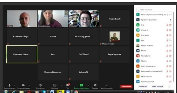
Принтскрин од официјалниот онлајн настан Бесмртен полк, 10 мај 2021. Извор: Фејсбук