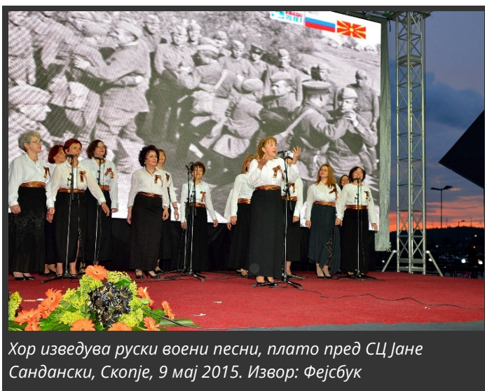
Хор изведува руски воени песни, плато пред СЦ Јане Сандански, Скопје, 9 мај 2015.

Истражувањето покажа дека првите корени на Бесмртниот полк во Северна Македонија датираат од 2015 година , кога е отворен јутјуб-каналот „Македонски бесмртен полк“ 9 . Каналот содржи неколку видеа чија содржина варира од стари македонски патриотски песни до пропагандистички видеа кои потекнуваат од Русија. Последното видео на овој канал е од пред 5 години.