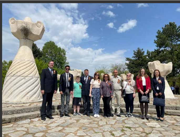
Прилеп, 8 мај 2022. Извор: Фејсбук

На 8 мај, делегација од Руската Амбасада, почесниот конзулат во Битола и членови на здруженијата за македонско-руско пријателство положија цвеќе на Могилата на непобедените во Прилеп. Делегацијата беше предводена од министерот-советник Александар Космодемјански 38 .