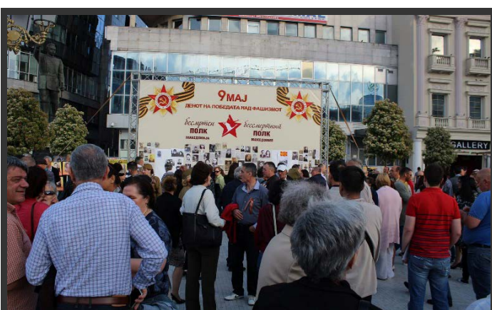
Скопје, 6 мај 2017, поставен првиот Суд на сеќавањето.

Во Северна Македонија, маршот на Бесмртниот полк за првпат се организира во 2017 година . Маршови на Бесмртниот полк беа организирани на 2 мај во Битола, и на 6 мај во Скопје. Првиот настан беше организиран од Меѓународниот славјански универзитет „Державин“ и на него учествуваа околу 100 студенти, професори и граѓани.