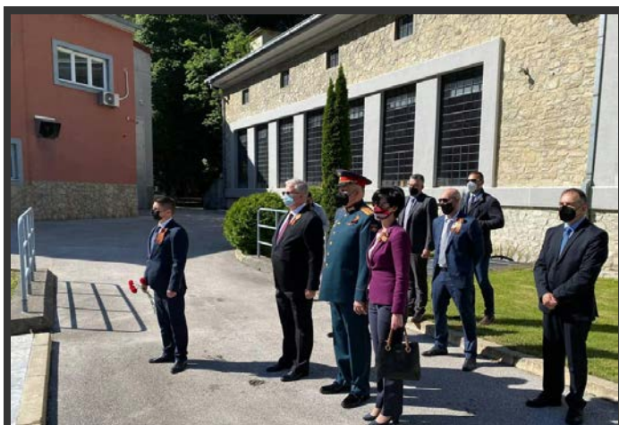
Церемонија во Матка близу Скопје, рускиот амбасадор Баздникин и гости, брана Матка, 9 мај 2021.

На 8 мај, делегација од Руската амбасада им оддаде почит на паднатите борци во Здуње, како што тоа беше случај во 2020 година.