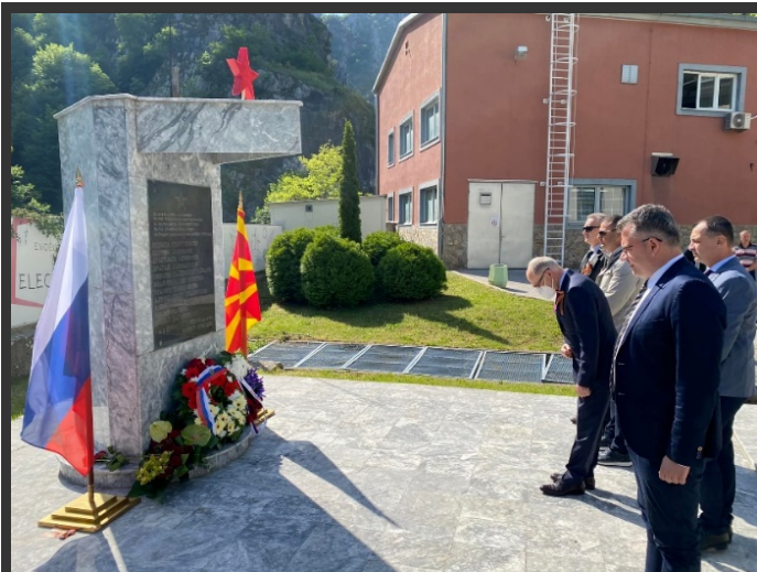
Матка (Скопје), 9 мај 2022.