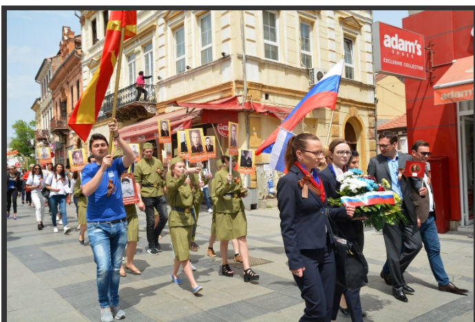
Битола, 2 мај 2017 – Првиот марш на Бесмртниот полк организиран во Северна Македонија.

Во Северна Македонија, маршот на Бесмртниот полк за првпат се организира во 2017 година . Маршови на Бесмртниот полк беа организирани на 2 мај во Битола, и на 6 мај во Скопје. Првиот настан беше организиран од Меѓународниот славјански универзитет „Державин“ и на него учествуваа околу 100 студенти, професори и граѓани.