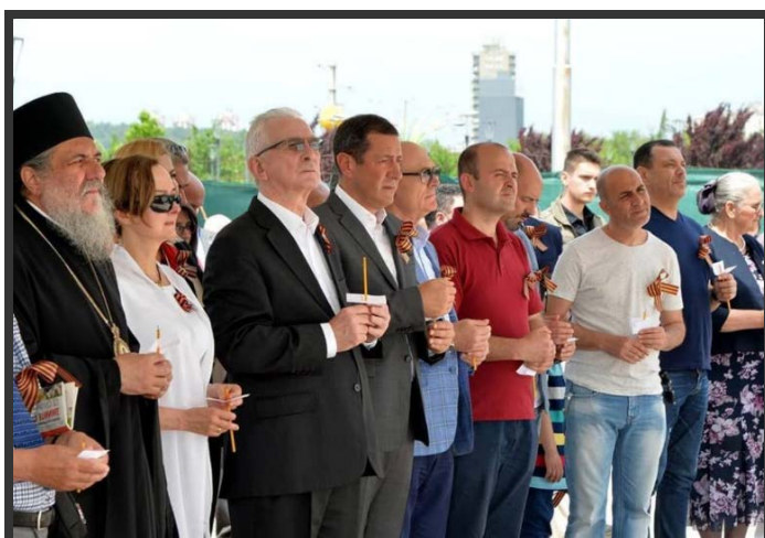
Скопје, 5 мај 2018.

Покрај овие два настани во рамките на програмата на Амбасадата и вклученоста на разни здруженија за македонско-руско пријателство и академијата, бројот на настани се зголеми. Беше организирана серија концерти низ државата од различни субјекти, како што се Општина Струмица и МСУ „Државин“ во Свети Николе, каде беа изложени фотографии од деца од градинка, придружени со нивните мисли за Победата во Големата војна. Покрај „традиционалните прослави“ во Битола и Скопје во минатото, оваа година во програмата беа вклучени и Свети Николе, Струмица и Прилеп. Во Прилеп беше вклучен локалниот огранок на Здружението за македонско-руско пријателство, а рускиот амбасадор положи цвеќе на Могилата на непобедените. Вклучувањето на Могилата на непобедените има голема симболика, затоа што е еден од најголемите и најзначајните споменици од Втората светска војна изграден во 1961 година 18 , а Прилеп е еден од градовите кој беше прогласен за град-херој во СФР Југославија.