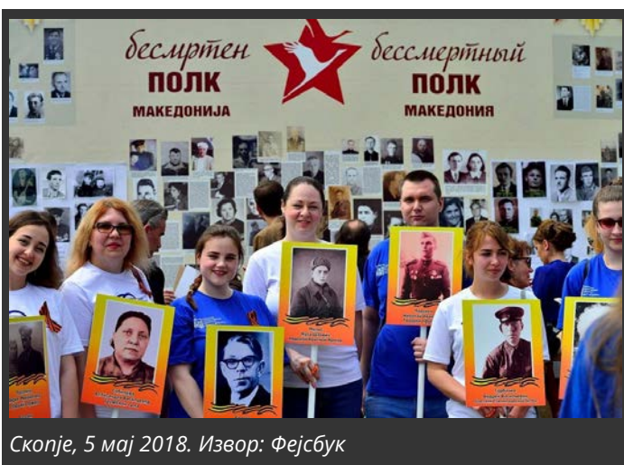
Скопје, 5 мај 2018.

Настанот „Бесмртен полк“ во 2018 година беше организиран на 5 мај во Скопје, каде беше поставен „Сидот на сеќавањето“, на којшто ветераните и заинтересираните граѓани можеа да поставуваат фотографии од нивните блиски кои биле дел од антифашистичкиот фронт. Руската амбасада во Скопје најави дека на 5 мај настанот „Бесмртен полк“ ќе се одржи во Скопје, додека пак во