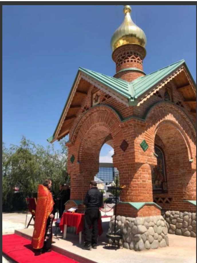
Религиозна церемонија за паднатите во Втората светска војна во црквата Св. Ѓорѓи Победоносец, Скопје, 9 мај 2019

практиката во Русија. „Сидот на сеќавањето“ е симболот на овој настан кој што Кремљ го употребува во таргетираните земји.