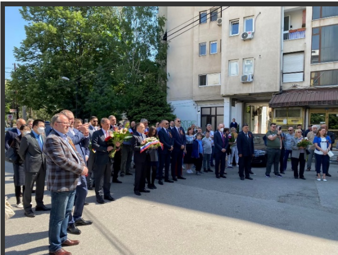
Скопје, 9 мај 2022.

Од фотографиите кои се објавени на фејсбук-страницата на Амбасадата не може да се утврди бројот на присутни на настанот 40 .