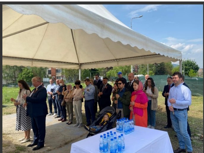
Скопје, 7 мај 2022.

Во 2022 година исто така беа организирани повеќе настани по истата шема. На 7 мај, во параклисот Св. Ѓорѓи Победоносец во Скопје се одржа молебен „за помен на руските војници загинати во сите времиња за верата и Татковината“ 37 .