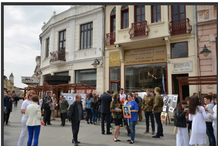
Битола, 9 мај 2018.

„А.А. Ростковски“ од Битола 17 и „Сојузот на здруженија за македонско-руско пријателство во Р. Македонија“